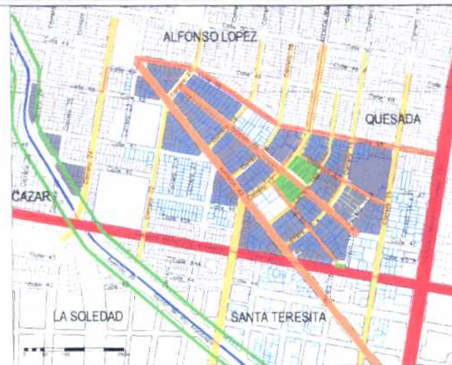
Inmuebles de Interés Cultural - MORFOLOGÍA EN PLANTA