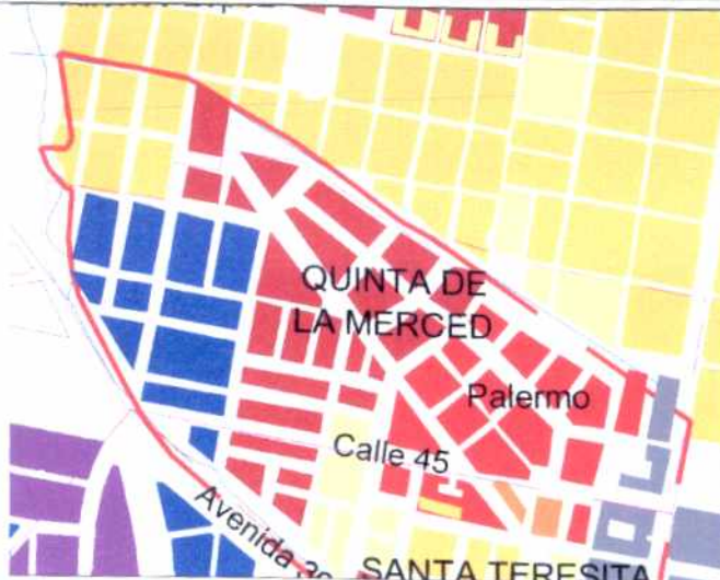
CRECIMIENTO HISTÓRICO - CRONOLOGÍA